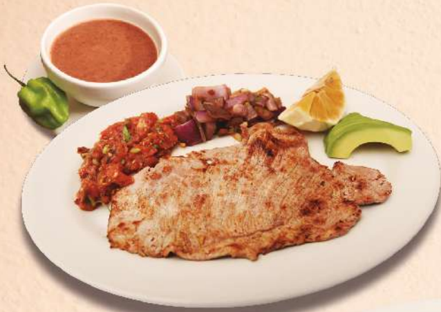
100 gr. POC-CHUC