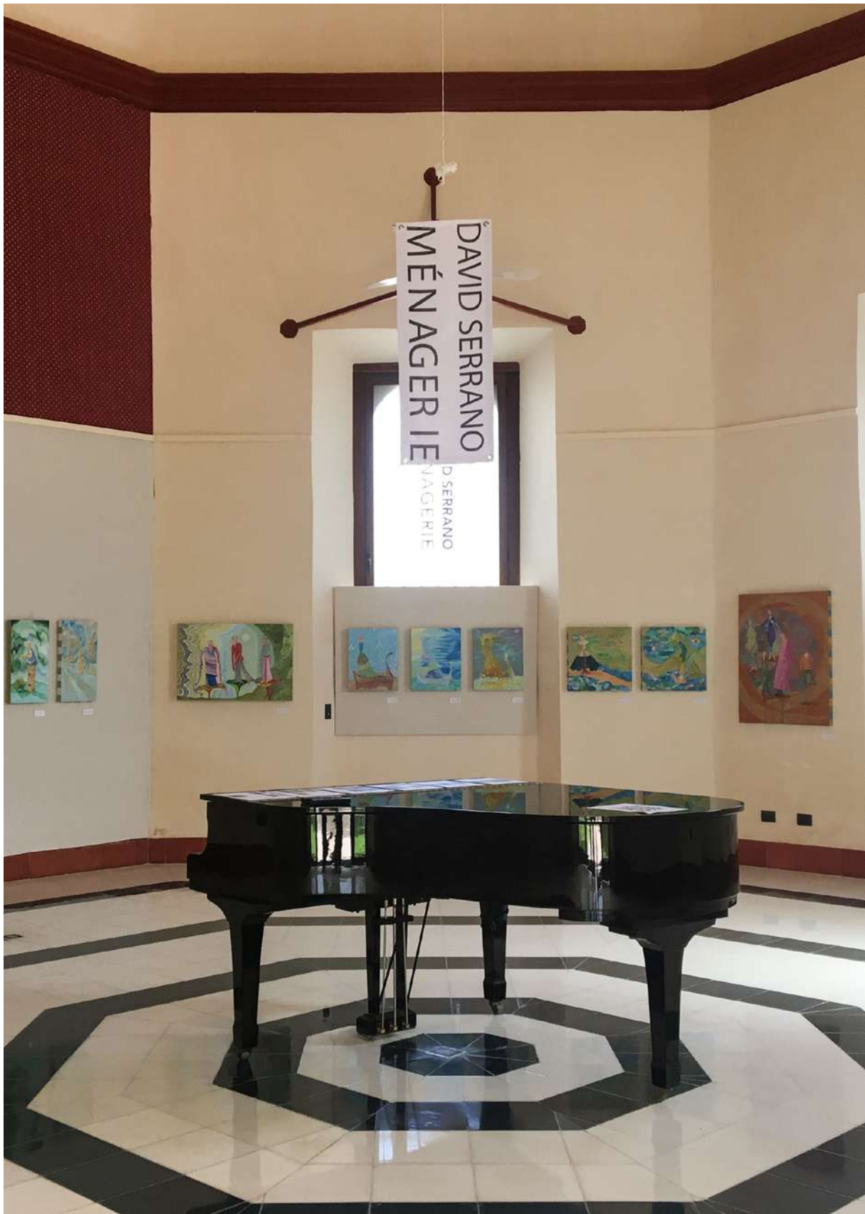
Título: Ménagerie. Artista: David Serrano