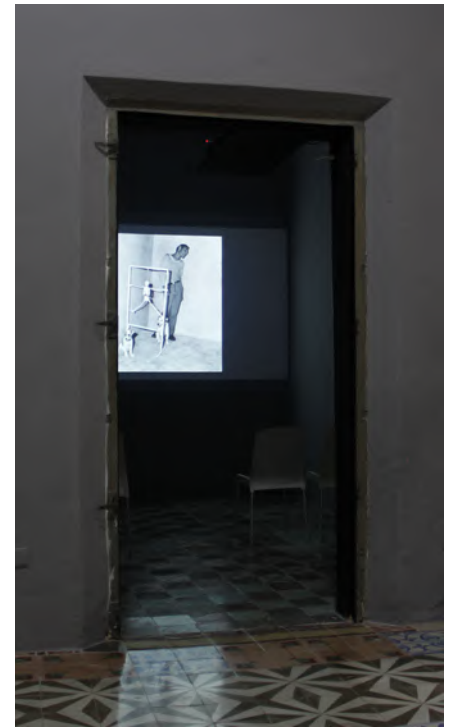
Proyección de Roger Ballen © CCC 2017.

"Cada vez que es posible, los artistas se reúnen con el público, con la finalidad de fomentar un vínculo entre los creadores y los espectadores".