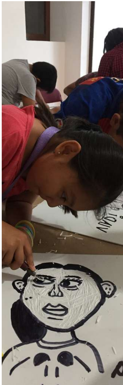
Taller infantil de grabado.