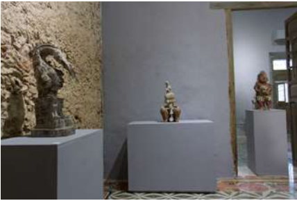
Exposición de Demián Flores © CCC 2018.