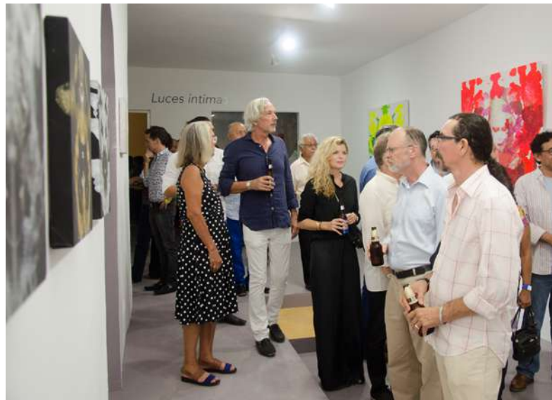
Inauguración de la exposición Luces íntimas de Kimiko Yoshida.