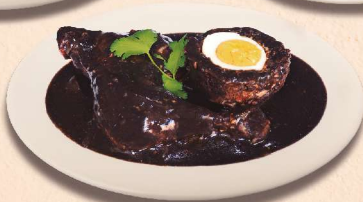
2 pzas. RELLENO NEGRO