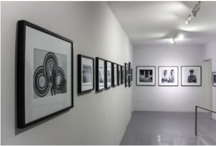
Exposición de Pepe Molina © CCC 2019.