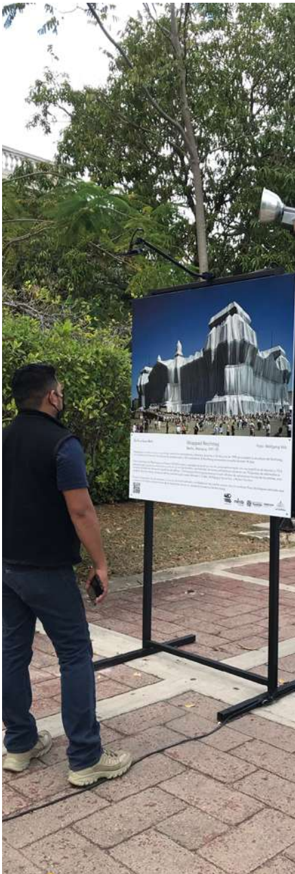
Exposición Christo y Jeanne Claude por Wolfgang Volz © CCC 2022.