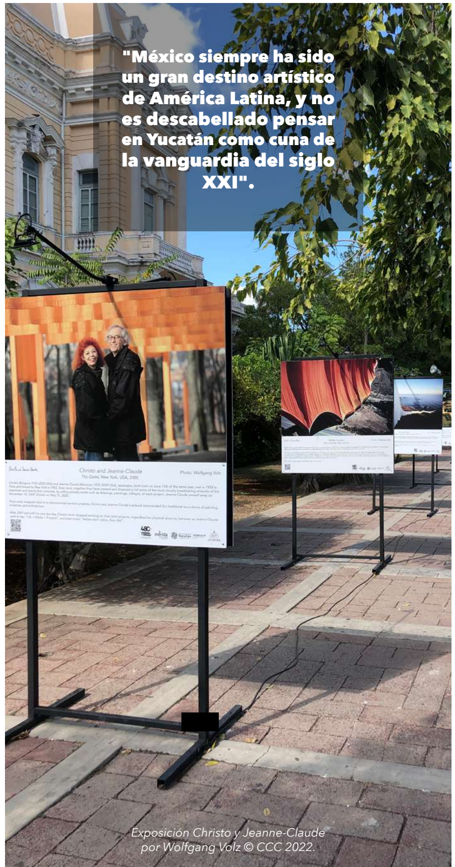
Exposición Christo y Jeanne-Claude por Wolfgang Volz © CCC 2022.