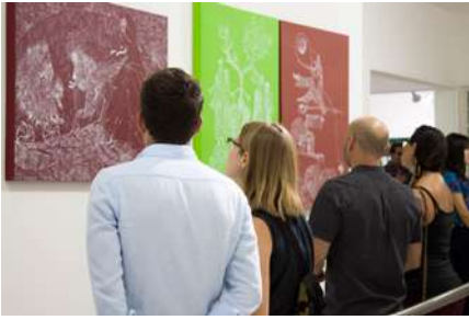
Exposición de David Serrano © CCC 2017.