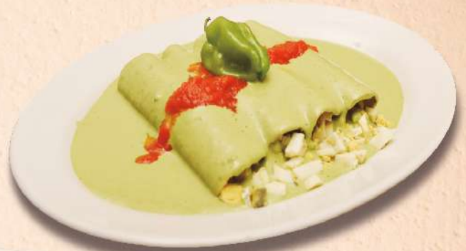
4 pzas. PAPADZULES