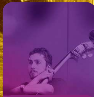
Red de Agentes Culturales de Yuc.