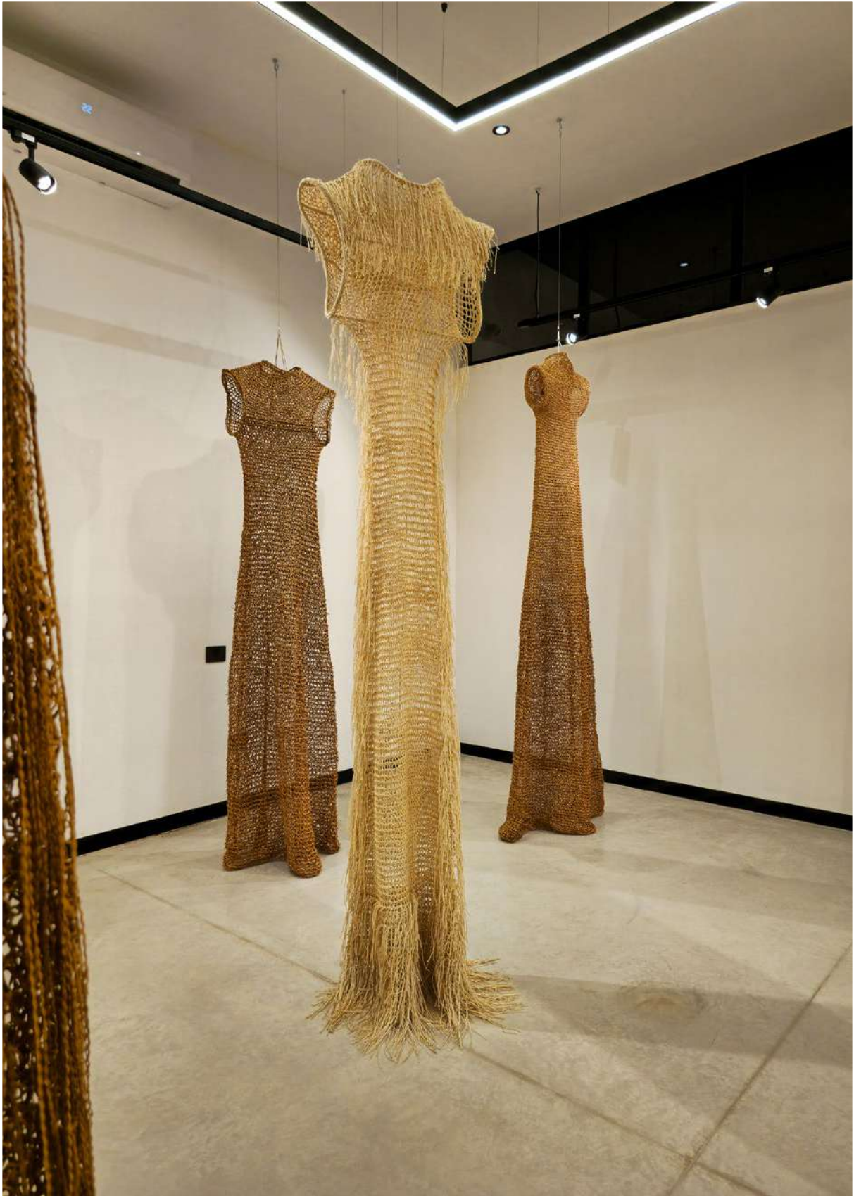
Exposición "Diálogos", de Marcela Díaz