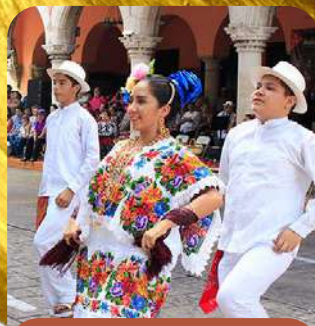
Mérida Capital Cultural