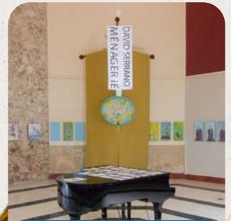
Centro Cultural la Cúpula