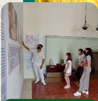
Museo de la Canción Yucateca