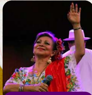
Palacio de la Música